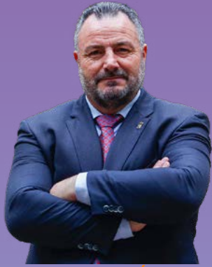
EDUARDO MORÁN PACIOS ALCALDE DE CAMPONARAYA